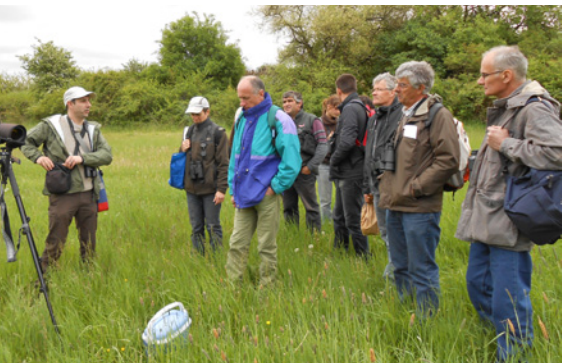
Observations terrain proposées durant cette journée