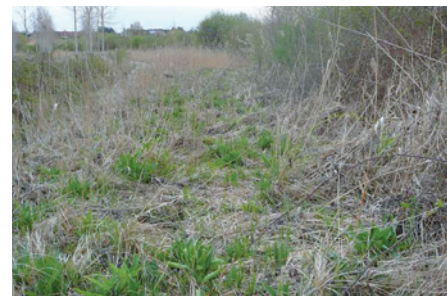
Frange de la Roselière en bordure de la rivière Cisse

Le CDPNE réalise alors un diagnostic écologique du site qui vise à vérifier si les milieux correspondent bien aux milieux remarquables des marais (chaque contrat répond à un cahier des charges précis). Il met en évidence tous les habitats naturels propres au marais, la faune et la flore associés. Ce diagnostic propose également le plan de travaux à suivre pour la durée du contrat, à savoir 5 ans.