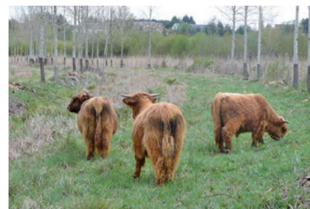
Jeunes bovins Highland Cattle sur une parcelle de marais voisin

La commune d'Averdon s'engage donc à respecter sur 5 ans, un calendrier de travaux dont certains lui sont remboursés. Par exemple, en année 1, il s'agira de restaurer les milieux ouverts par débroussaillage et d'installer des équipements pastoraux (clôtures). Ces derniers serviront, en année 2 et 3 à entretenir le marais par pâturage. Pour le réaliser, la commune s'est rapprochée d'un agriculteur qui interviendra en tant que prestataire et fera pâturer ses bêtes sur les marais (bovins de race Highland Cattle).